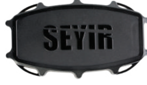
NTS Nesne Takip Sistemi