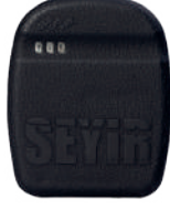
SYR ST10 Standart Araç Takip Sistemi