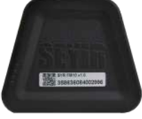
SYR FM10 Filo Yönetim Sistemi